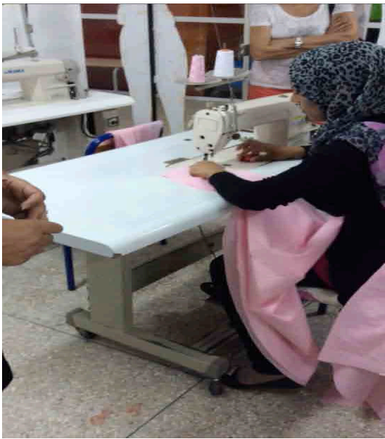
Maman en formation couture.