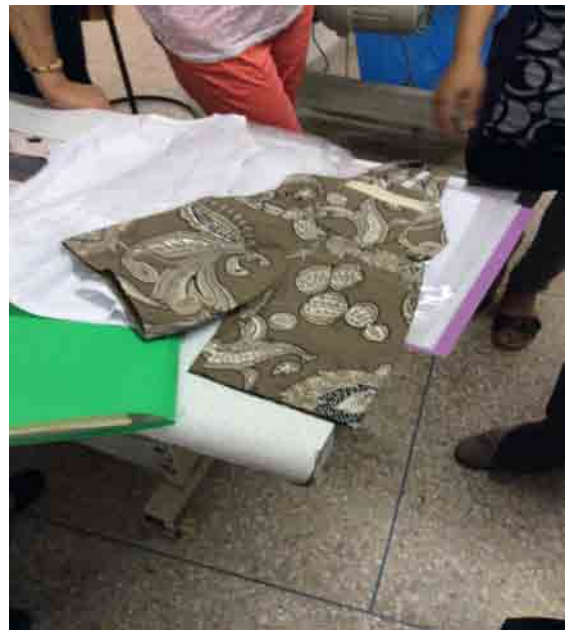
Réalisation de l'examen final qualifiant.