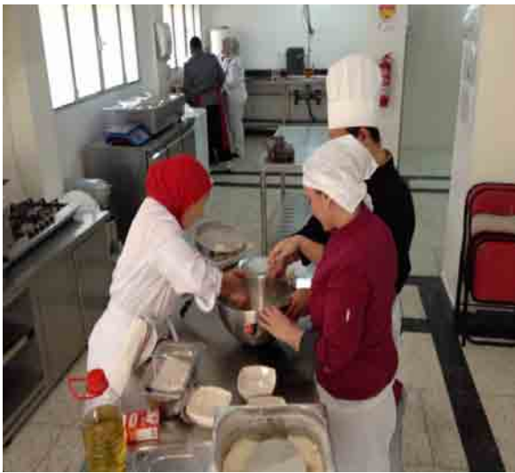
Mamans en formation cuisine.